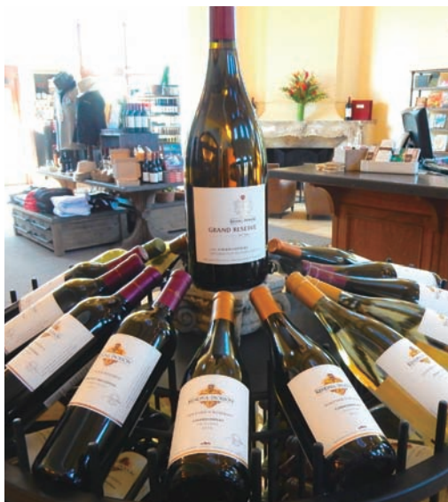
▲シャルドネが有名な「ケンダル・ジャクソン・ワイナリー」のラインナップ。