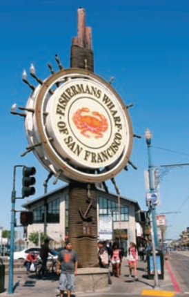
▲人気観光スポットのフィッシャーマンズワーフ。