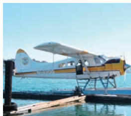
▲水上遊覧飛行は約30分、US$160～。

また、ぜひトライしていただきたいのは、乗り物体験です。その一つは、水上飛行機によるサンフランシスコ湾の遊覧飛行。飛行時間は30分ほどです。が、ゴールデンゲートブリッジやアルカトラズ島、サンフランシスコの街を上空から眺めるという経験は、素敵な旅の思い出になるでしょう。