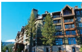
▼多彩な宿泊施設が揃うレイクタホ。スキーをはいたままアクセスできるリゾートホテルも。