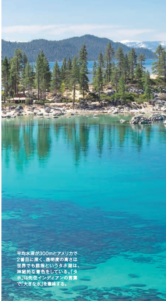
平均水深が300mとアメリカで2番目に深く、透明度の高さは世界でも屈指というタホ湖は、神秘的な青色をしている。「タホ」は先住インディアンの言葉で「大きな水」を意味する。