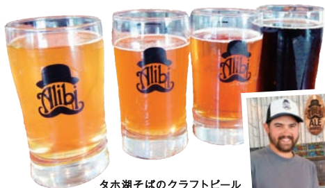
タホ湖そばのクラフトビールのこの店では、ライトからダークまでおいしいヨーロピアンスタイルのビールを試飲できる。試飲サイズは1杯US$2〜。