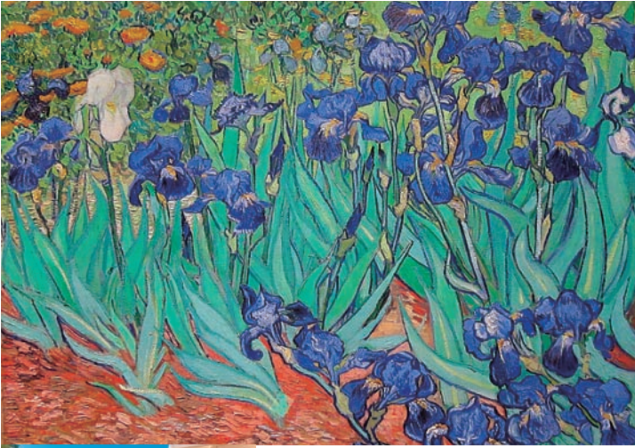
▲フィンセント・ファン・ゴッホ「アイリス」1889年 ロサンゼルス、ポール・ゲティ美術館蔵