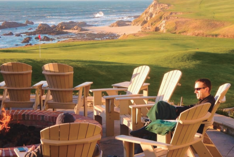
海風を感じながら、ゴルフコース横のテラスで談笑するサンセット前のひと時。