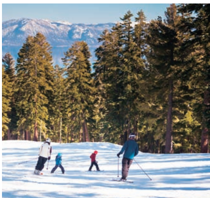
▲スキーリゾートとして有名なレイクタホだが、四季折々のアウトドアスポーツも楽しめる。